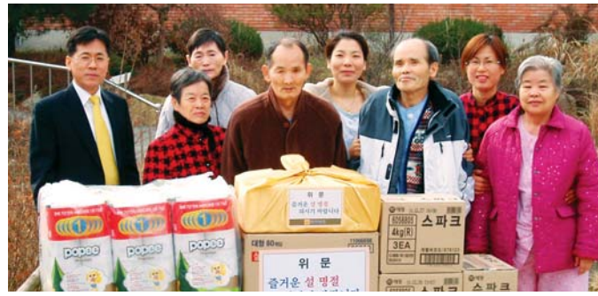
정순남 전남도 경제부지사는 설 명절을 앞둔 지난 18일 아동 양육시설인 나주 금성원과 노인요양시설인 나주 수덕의집, 광주 보훈병원 등을 차례로 방문해 위문품을 전달하고 생활자 등을 격려했다.