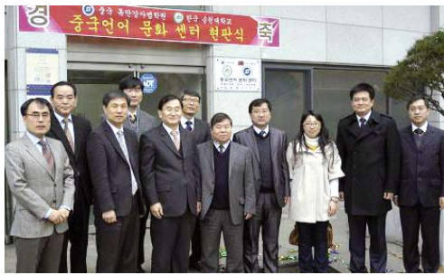
고 2012년 4년제 대학의 출발과 양교 상호간의 교류 및 중국 목단강사범학원의 언어·문화·교류와 교수·학생 교류에 대해 논의했다. 이어 목단강사범학원 방문단은 3일 동안 광주 현대기아자동차, 광주박물관을 비롯한 광주의 첨단산업과 문화예술을 견학한다.