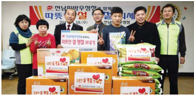
전남지방우정청은 지난 18일 오후 나주시에 위치한 장애인 사회복지시설인 나주계산원을 방문해 쌀과 과일 등 위문품을 전달하고 격려했다.