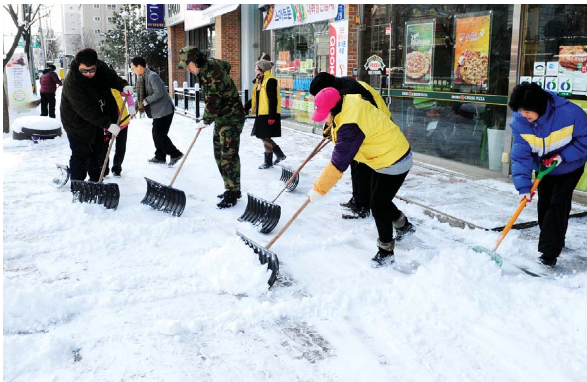
25일 광주에 최고 7.2cm의 눈이 내렸다. 광주시 북구 운암1동 직원들과 부녀회원들이 이면도로의 눈을 치우고 있다.