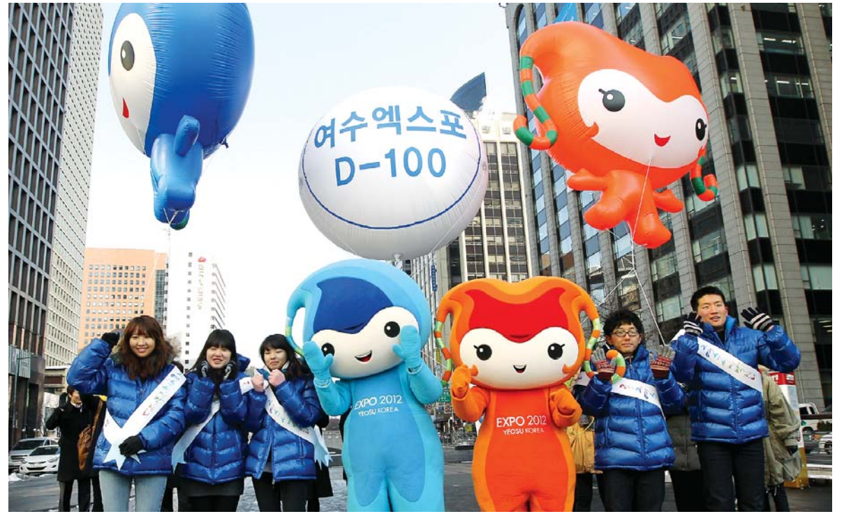
여수박람회 성공개최 기원합니다 2일 오후 서울 청계광장에서 열린 여수세계박람회 D-100 성공회 행사에서 마스코트 여니 수니 등 관계자들이 거리 퍼레이드를 벌이고 있다.

대한 물갈이가 이뤄질 가능성에 주목하고 있다. ◇인적 쇄신 규모=일단 공천 과정에서 민주통합당 현역 국회의원 가운데 적게는 20%, 많게는 30% 가량이 탈락할 것이라는 관측이 우세하다. 17명의 현역 국회의원이 경선에 나서는 광주·전남지역에서는 후보자 심사 과정에서 30% 이상인 5~6명이 탈락할 가능성이 높은 것으로 분석되고 있다. 여기에 야권연대와 여성 후보자 공천 등 전략 공천이 포함되면 현역 국회의원들의 탈락 폭이 더 넓어질 수 있다. 특히, 지역 민심을 중심으로 변화와 혁신을 요구하는 바람이 거세게 불고 있어 경선에 진출한 현역 국회의원들이 경쟁에서 패배하는 경우도 속출할 수 있다. 지역 정치권에서는 19대 총선에서 광주·전남지역 현역 국회의원들이 결과적으로 50% 이상 물갈이 될 것이라는 관측을 내놓고 있다. /임동욱기자 tuim@kwangju.co.kr