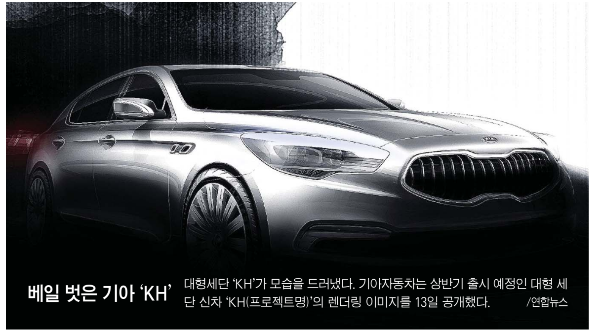
베일 벗은 기아 'KH' 대형세단 'KH'가 모습을 드러냈다. 기아자동차는 상반기 출시 예정인 대형 세단 신차 'KH(프로젝트명)'의 렌더링 이미지를 13일 공개했다.