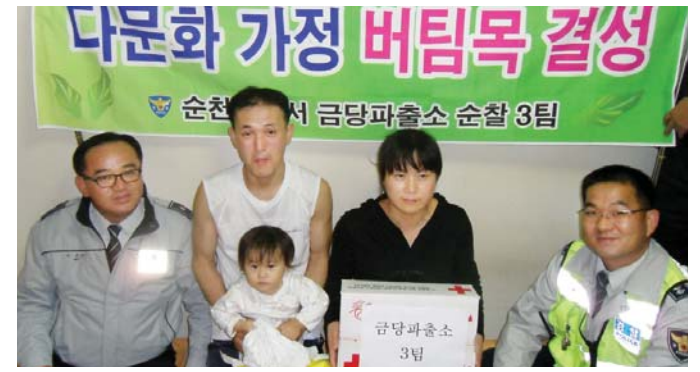
순천경찰서 금당파출소 순찰3팀은 최근 저소득 다문화가정 5세대와 자매결연을 맺고 매월 생활에 필요한 법률적 자문과 자녀교육 등 각종 애로사항을 해결해 주고 있다.