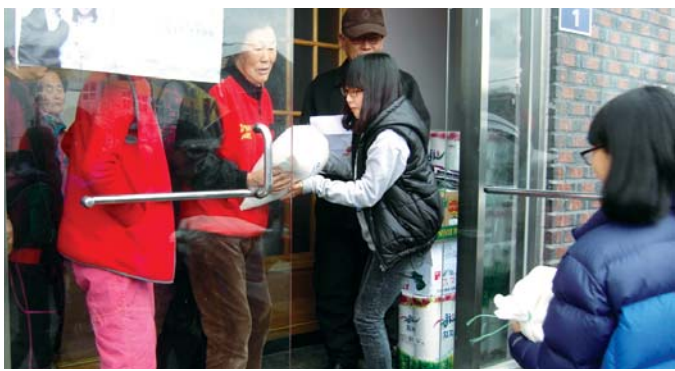
보성군 벌교초등학교 교직원과 학생들은 최근 독거노인 돕기 알뜰 시장을 열어 모은 성금 60만원으로 쌀과 생필품을 마련, 독거노인 14세대에 전달했다. /동부취재본부=김윤성기자 kim0686@