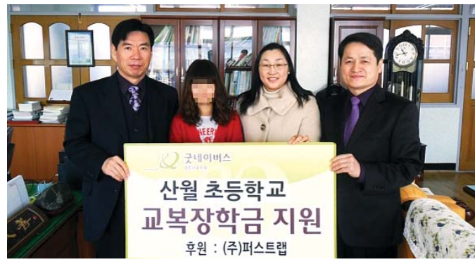
굿네이버스 광주 서부아동복지지원센터는 최근 BMW 코리아 미래재단과 (주)퍼스트랩의 후원으로 광주지역 16개 초등학교 학생 30명에게 희망장학금 500만원을 전달했다.