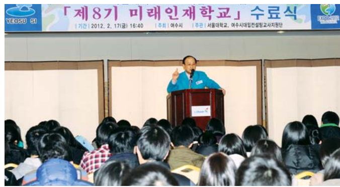
서울대학교의 고교지원 프로그램인 '제8기 미래 인재학교'가 최근 여수시 디오센터2층 금오도A홀에서 진행됐다.