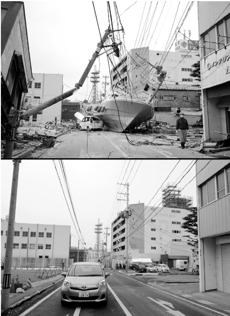
쓰나미 전후 미야기현 거리. 지난해 3월11일 일본 서해상에서 발생한 초대형 쓰나미에 휩쓸린 한 어선이 나흘 후 물이 빠져나간 미야기현 이노노마키의 도로에 처박혀 있는 모습(사진 위). 1만9000명 이상의 인명을 앗아간 거대 쓰나미 발생 후 1년이 되어가는 지난 1월 13일, 엄청난 잔해들로 뒤덮였던 당시의 거리는 말끔하고 활기찬 모습을 되찾았다.

후보자에 대한 가산점 기준도 총선 후보자 기준과 같이 여성과 중증장애인은 15%, 40세 미만 청년과 사무직 당직자 및 당 공로자 10% 각각 가산하기로 하되 당 위원회 회계 중 제명·당원자격정지·당직자격정지·당직직위해제의 경우는 10%, 경고는 5%의 감점을 주기로 했다.