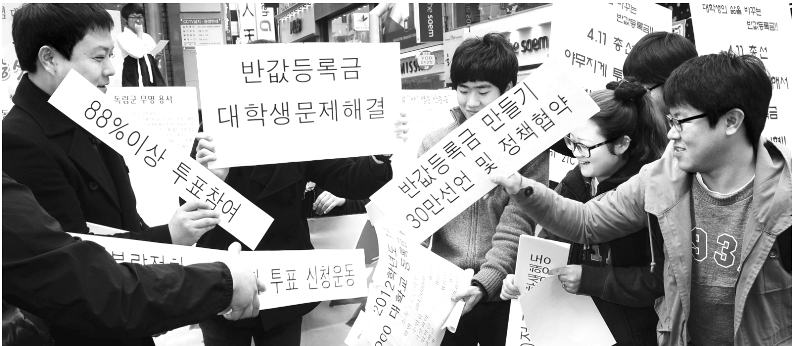
'반값 등록금' 쟁취 퍼포먼스

광주·전남지역 대학생들이 1일 오후 광주 동구 충장로 광주우체국 앞에서 '반값 등록금' 쟁취를 위한 퍼포먼스를 하고 있다. 이들은 이날 '반값 등록금 국회 만들기 광주·전남 대학생 운동본부'를 발족시켰다.