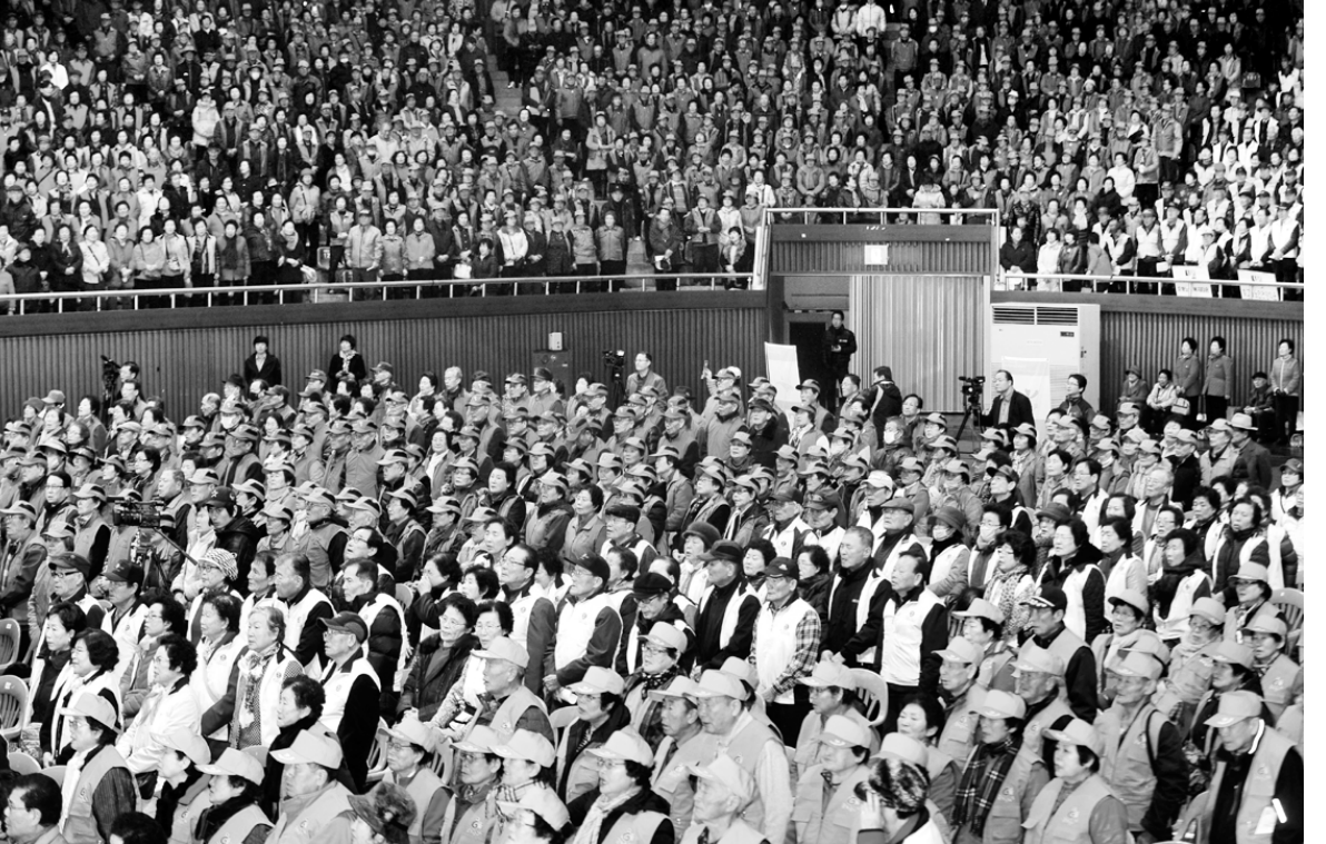
노인 일자리 발대식

경찰은 이들 외에도 광주지역 중·고교 8곳에서 일명 '양언니와 양동생' 관계를 맺고 있는 학생 29명이 있음을 확인했으며 가해학생들로부터 양자에 대해 다짐서를 자진 제출 받는 등 선도하기도 했다고 밝혔다. 경찰 관계자는 "조직폭력배들이 보호비 차원에서 서민들로부터 돈을 빼앗는 '상납교리'가 청소년들 사이에서도 벌어지고 있어 문제다"고 말했다. /김대성기자 bigkim@kwangju.co.kr