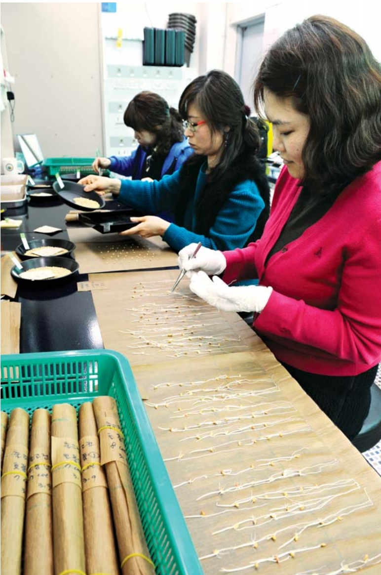
지난 9일 국립종자원 전남지원 품질관리실에서 연구원들이 농가에 공급될 정 부보급종 법씨 발아율을 측정하고 있다.

올 감소가 확인된 품종이다. 이와 함께 전남지원은 법씨 발아율 검사를 기존 2회에서 5회로 강화했다. 이전에는 수매시와 정식제품을 대상으로 발아율 검사를 했지만 건조 저장전·보관품 검사·출고전 검사 등 3단계 검사를 추가했다. ‘불량법씨’ 원인중 하나로 지목된 소독약제도 기존 제품으로 환원했다. 특히 전남지원은 앞으로 전남도 농업기술원, 나주·영암·해남 등 3개 시·군 농업기술센터와 함께 합동 육 묘시험을 실시할 계획이다. 국립종자원 전남지원 서영범 검사 과장은 “일부 농가에서 미소독된 법 씨에 대해 종자소독을 하지 않고 과 종할 경우 ‘키다리병’ 확산이 우려된 다”며 “종자전염병 방제를 위해 소독 방법을 철저히 따르고, 1~2mm 정도 의 썩이 70~80% 이상 뜯 것을 확인 한 후 법씨를 파종해 줄 것”을 당부했 다. 문의(061-323-0702) 한편 지난해 도내에서는 벼 보급종 총공급량 4520t 가운데 호퍼벼·동진 2호 등 소독된 일부 품종(1041t)의 발 아율이 급격히 떨어져 농가의 원성을 샀다. /글·사진=송기동기자 song@