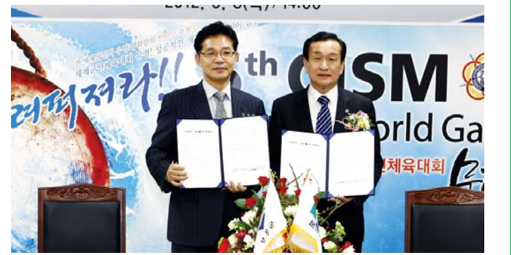
보성군과 문경시가 지자체 우호 증진을 위한 업무 협약을 체결했다.