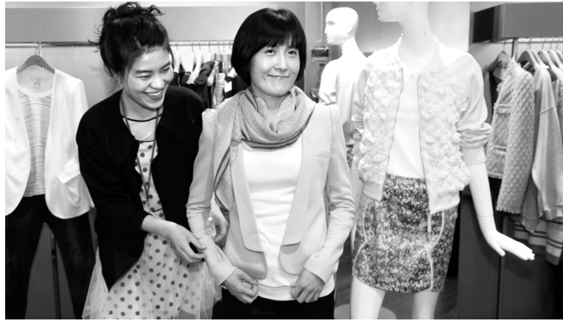
16일 광주신세계 백화점 여성리뷰 매장에서 한 여성 고객이 올 봄 유행 색상인 노란색 계열의 재킷을 입어보고 있다.