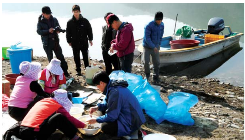
고흥군은 최근 관내 저수지 6개소에 전남도 내수면 시험장에서 지원받은 빙어 수정란 500만개를 방류했다.

올해 전남지역 저수지 등 내수면에서 민물고기 치어 7200만여 마리가 방류된다. 전남도해양수산과학원 내수면시험장은 수산자원 조성을 위해 올해 3차례 걸쳐 빙어 수정란을 비롯해 붕어, 잉어, 뱀장어 등 11종 7200만여 마리를 방류한다고 20일 밝혔다.