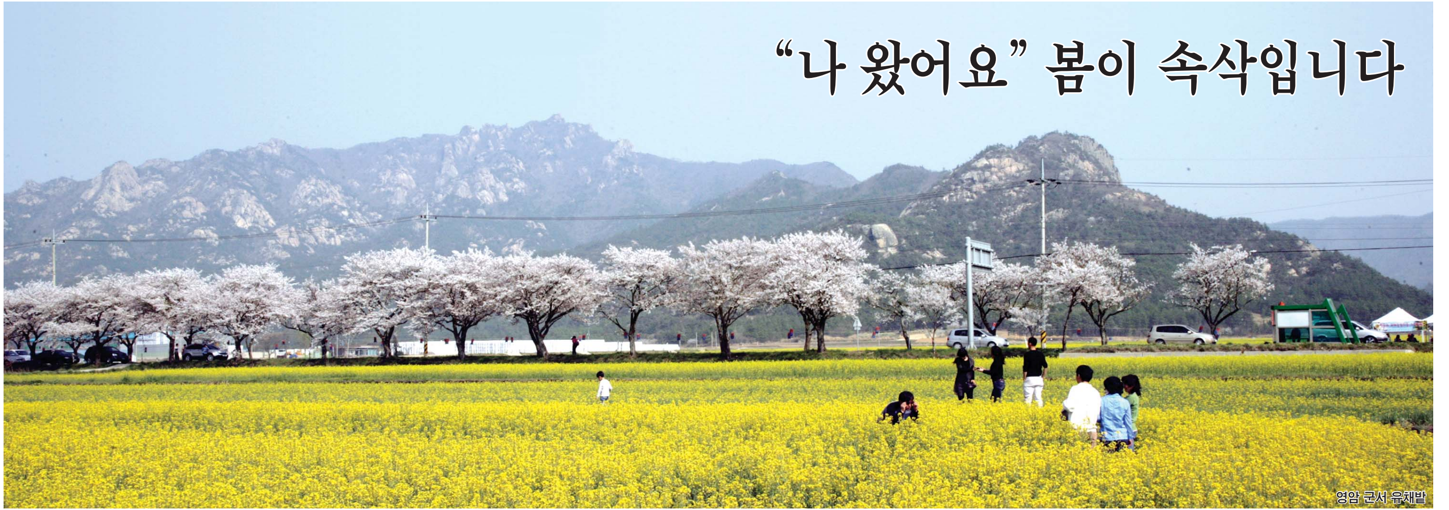
영암 군서 유채밭

살랑살랑 봄바람 따라서 겨울을 견뎠던 꽃망울들이 기지개를 켜기 시작했다. 꽃을 시샘한 추위도 물러나면서 발걸음 하기 에 더없이 좋은 시간이다. 꽃의 계절, 꽃바람 타고 꽃길 따라 봄을 맞으러 가자.