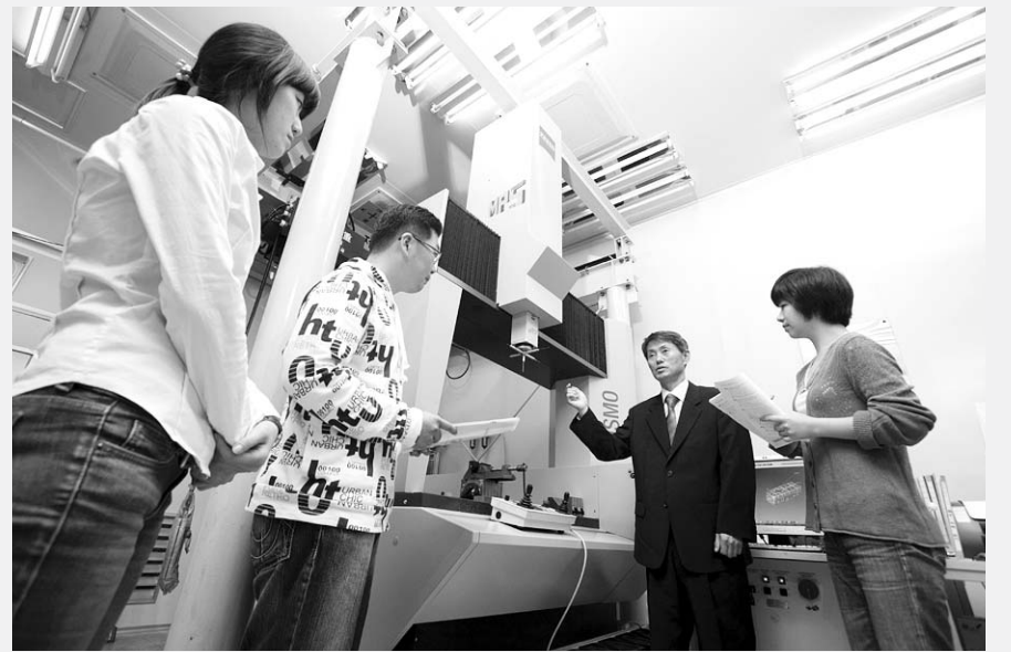
창업을 희망하는 대학생들이 광주시 광산구의 '조선대 첨단산학협력센터'에서 실습하고 있다.

▶ 조선대는 그동안 창업보육센터 설치·첨단산학협력센터 운영·기술지주회사 설립 등