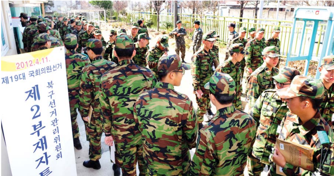
부재자 투표 시작 4·11 총선 부재자 투표가 시작된 5일 광주시 북구 삼각동 31사단 비전센터에서 장병들이 투표를 하기 위해 줄지어 서 있다. 전국 대상자는 모두 86만1000명으로 유권자의 2.1%. 부재자 투표는 6일까지 이뤄진다.

광주 동구에서는 무소속의 양형일 후보가 33.2%의 지지율을 기록, 26.5%의 무소속 박주선 후보와 17.6%의 무소속 이병훈 후보를 따돌리며