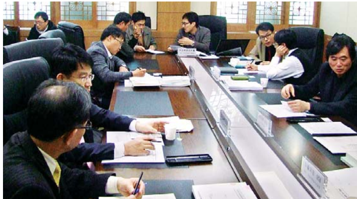
광주전남중기청 등 10여개 중소기업 지원 기관이 공동으로 최근 나주시청에서 현장 상담회를 열고 중소기업들의 애로를 청취했다.

“정책자금 융자·보증 지원 등 물어볼 게 많은데, 관련 기관들이 나주까지 찾아와 한 곳에서 상담 해주니 편하고 큰 도움이 됐습니다.”