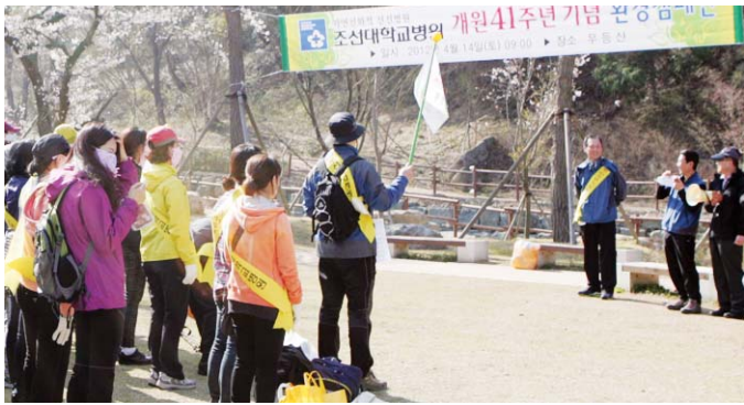
조선대병원(병원장 민영돈)은 제41주년 개원기념일(4월15일)을 맞아 기초학습 및 정서발달 지원과 부모교육, 가족 문화체험, 건강검진 그리고 재능기부 등 드림스타트 가정의 복지서비스 제공을 위해 노력한 점이 높은 평가를 받았다.