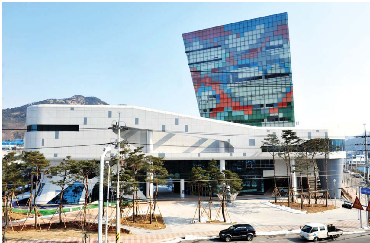
지난 3월7일 광주 남구 송하동에 개관한 광주CGI센터 전경. 디지털콘텐츠 문화산업을 선도할 이 센터는 문화산업투자진흥지구로 선정됐으나 기업체 유치나 고용창출 효과는 미미한것으로 지적됐다.

주 문화콘텐츠 종사자 비중 전국 2.2%에 불과할 정도로 미약한 실정인 것으로 드러났다.