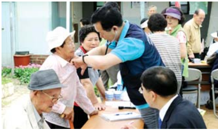
지난해 중앙나누리가 진행한 의료봉사.

한다. 이번 4차 사업에는 서구청 직원과 상일중학교 교사들도 휴무 토요일을 반납하고 자원봉사자로 참여 '이웃사랑'을 함께 나눌 예정이다. /김미은기자 mekim@