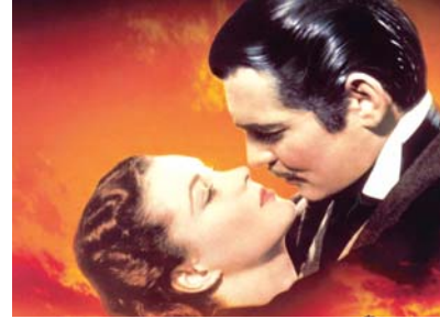
'바람과 함께 사라지다'

시한다. ◆음악으로 통(通)하다 지난 6년 동안 프랑스문화원과 함께 진행해온 프로그램으로 다양한 장르의 콘서트와 음악영화가 어우러진 행사다. 올해 콘서트는 프랑스 파리를 중심으로 활동하는 재즈 그룹 '허대옥 트리오'의 재즈 공연이다. 5월 12일 오후 5시. 재즈 피아니스트 허대옥이 이끄는 허대옥 트리오는 젊은 드러머 매튜 사자랑, 나운선 퀸트의 멤버로 많이 알려진 베이시스트 요니 켈닉으로 구성된 그룹으로 이번 공연에서는 유려한 재즈의 진수를 선사할 예정이다. 공연 후에는 진 켈리 주연의 뮤지컬 영화 '사랑은 비를 타고'가 상영된다. 티켓 가격 2만원. (예매시 1만5000원). http://cafe.naver.com/cinemagwangju/ 문의 062-224-5858. /김미은기자 mekim@kwangju.co.kr