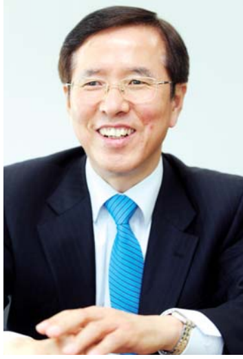
2016년 총회를 프랑스와 경쟁 끝에 유치하는 데 성공하는 등 대한민국의 기록의 국제적인 위상을 높이는 데 최선을 다하고 있다. /윤현석기자 chadol@

“기록과 자료를 중시하는 도시야말로 문화도시입니다. 선진국들이 과거를 소중히 하는 것은 그것이 곧 미래를 담보하는 자양분이기 때문이죠.” 지난 4일 오후 국가기록원 광주기록정보센터 개소식에 참석한 송귀근(55) 행정안전부 국가기록원장. 광주시 행정부시장을 마치고 지난해 10월 원장으로 취임한 그는 수도권은 물론 부산·대전 등에 비해 국가기록 및 자료 접근에 취약한 광주·전남지역민을 위해 광주기록정보센터 확장 이전을 추진해왔다. “지난해 3월 광주기록정보센터가 문을 열었지만 열람실 규모도 작고 자료가 거의 없는 것은 물론 홍보도 제대로 안 됐어요. 센터가 개관했지만 지역민들이 대전이나 성남까지 찾아가는 불편함은 그대로였죠. 각고의 노력 끝에 예산을 마련,