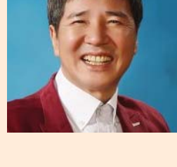
최병서 | 개그맨 | 관련사업 7080라이브존 운영 주요작품 소행운열차, 청춘 행진곡, 코미디전망대, 웃으며 삼시다, 최병서 개그디너쇼 외 다수