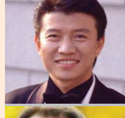
김한국 | 개그맨 | 관련사업 코메디클럽 운영 주요작품 코미디세상만사, 쇼 비디오 자키, 유머1번지 스프리광부부, 무엇이든 물어보세요 외 다수