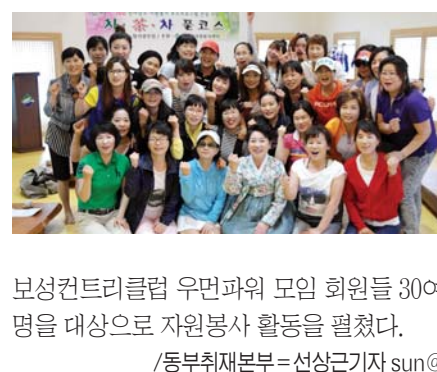
보성컨트리클럽 우먼파워 모임 회원들 30여명을 대상으로 자원봉사 활동을 펼쳤다.