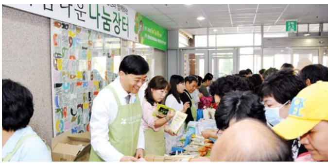
화순전남대학교병원(원장 국훈)이 개원 8주년을 기념해 17일 오전 병원 로비에서 아름다운가게 광주전남본부와 공동으로 '아름다운 나눔장터'를 열었다.