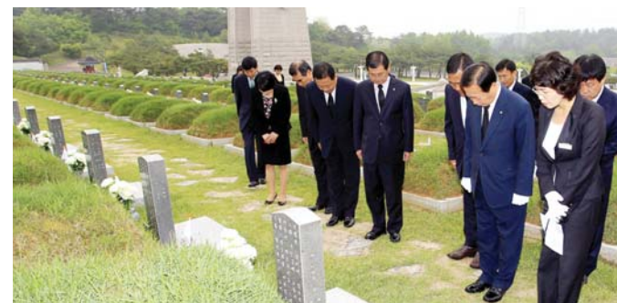
5·18 민주화운동 제32주년을 맞아 홍익시 화순군수와 화순군청 간부공무원 25명은 최근 국립 5·18 민주묘지를 찾아 참배했다.