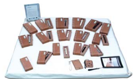
전주한지문화축제 행사의 하나로 열린 제18회 전국한지공예대전에는 전국에서 일반부 206점과 학생부 50점이 출품됐으며 대상 1명, 금상 2명, 은상 3명