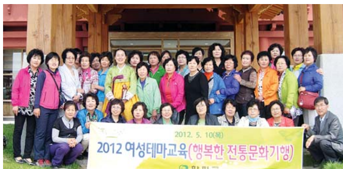
함평군은 최근 영암군에 위치한 한옥호텔 영산재에서 관내 여성단체 회원 40여 명을 대상으로 여성 테마교육을 실시했다.