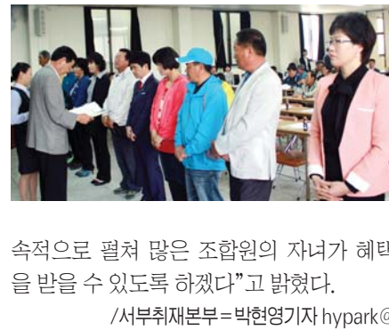
보성 참사랑모임 '차·차·차 폴코스 자원봉사' 호평

속적으로 펼쳐 많은 조합원의 자녀가 혜택을 받을 수 있도록 하겠다"고 밝혔다. /서부취재본부=박현영기자 hyark@