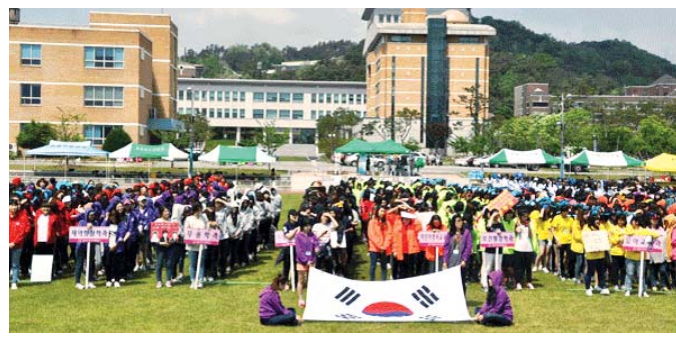
광주여자대학교(총장 주자문)는 최근 이를 동안 교내 천연잔디 대 운동장에서 24개 학과 재학생 4300여명의 학생들이 참가한 가운데 2012 '송강제전'을 개최했다.