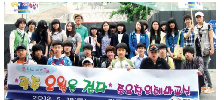
'데굴데굴 토요일의 체험' 프로그램 중 하나인 '광주의 오월을 걷다'에 참가한 광주 북성중 학생 50여명이 지난 19일 옛 전남도청에서 남동성당, 광주기독병원 등 5·18 시지지를 둘러봤다.