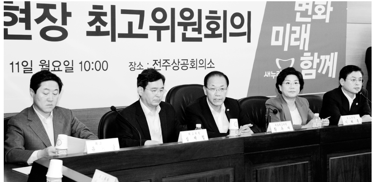
11일 오전 전북 전주 덕진구 전주상공회의소에서 열린 '전북 현장 새누리당 최고위원회의'에 참석한 황우여 대표가 모두발언을 하고 있다.

3선인 송 부의장은 여수 출신으로 여수시의원, 광양만권발전연구원 상임이사, 7·8대 전남도의원, 여수엑스포 전남도의회유치위원장, 민주당 전남도당 총무위원장 등을 역임했다. 또 광양 출신 김 의원은 전남지구 JCI회장, 광양만권 경제자유구역청 조합회 의장을 맡았다. 김 의원은 8대 후반기와 9대 상반기에 이어 3번째 도전장을 냈다. 오는 19일 오후 6시까지 의장 후보 등록을 한 뒤 본격적인 선거전에 돌입하게 되고, 현재 양측이 팽팽한 지지층을 보유하고 있어 근소한 차이로 당선자를 낼 것으로 예측되고 있다. 또 현 상임위원장 7명이 출사표를 낼 것으로 보이는 부의장 선거도 치열하게 전개될 것으로 예상된다. 지난달 탄생한 통합진보당 중심인 제3의 원내 교섭단체도 농수산위원회 상임위원장을 내기 위해 물밑 작업을 벌이고 있어 귀추가 주목된다.