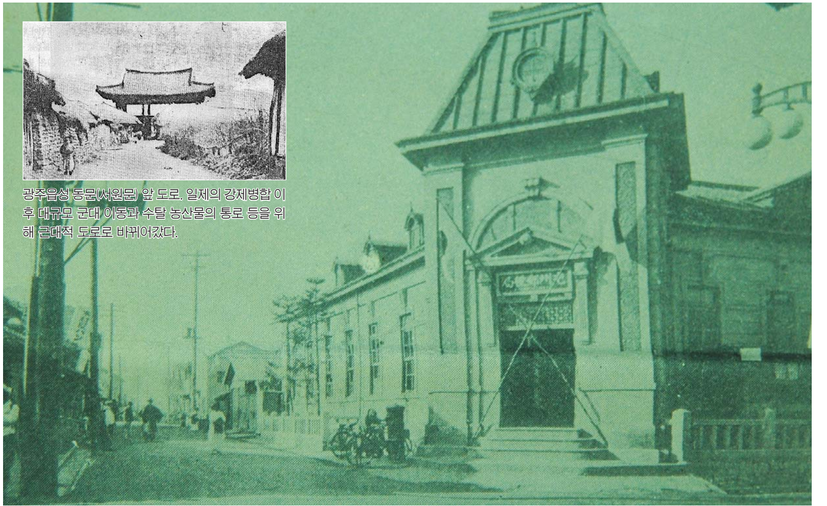
1920년대 광주우편국(광주우체국) 일대. 광주 최대의 변화가었던 충장로의 도로 폭은 당시 다른 어떤 도로보다 넓었다.