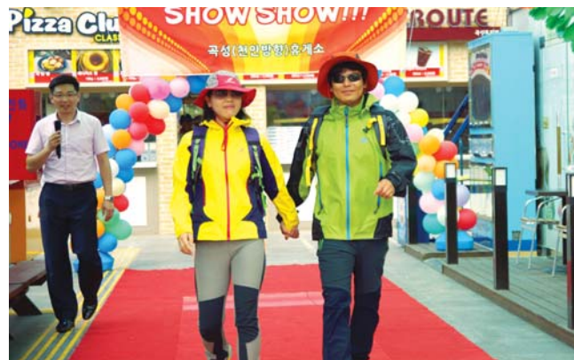
호남고속도로 곡성휴게소(논산 방향)는 최근 휴게소 광장에서 다양한 의상을 선보이는 패션쇼를 개최했다. 고속도로 휴게소에서 패션쇼가 열린 건 이번이 처음이다.