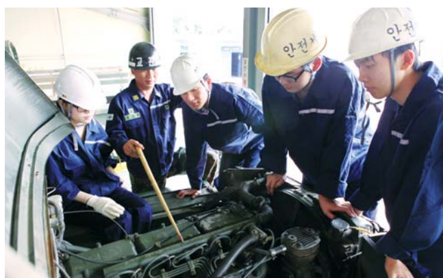
광주대 국방기술학부는 6월 호국보훈의 달을 맞아 지난 11일부터 1박2일 동안 육군 31사단에서 나라사랑 병영체험을 실시했다. <육군 31사단 제공>