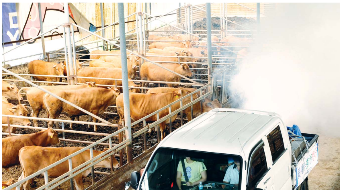
‘소 유행열’ 방역작업

광주시 북구청 직원들이 18일 석곡동 한 축사를 찾아 ‘소 유행열’ 등 가축 전염병 예방을 위해 방역작업을 실시하고 있다.