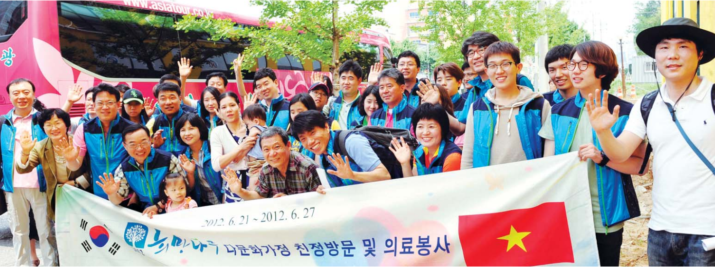
광주지역 결혼 이주여성 친정방문 길에 함께하는 (사)희망나무와 광주지역 의료진, 자원봉사자들이 21일 오전 광주 출발에 앞서 파이팅을 외치고 있다.