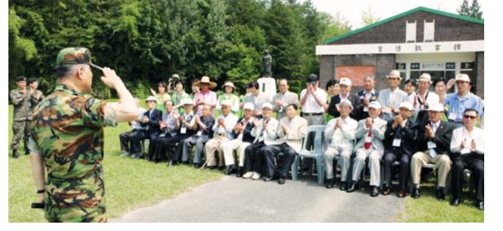
육군 31사단과 광주지방보훈청은 6·25전쟁 62주년을 맞아 21일 6·25 참전 국가유공자와 유족 등 34명을 사단 사령부로 초청, 오찬을 함께하고 군 장비 및 보급품 견학 등의 행사를 가졌다.