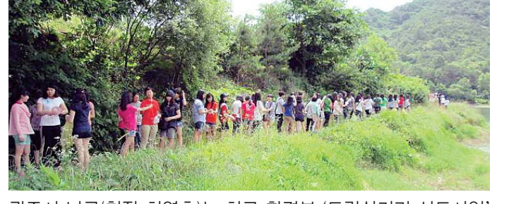
광주시 남구(청장 최영호)는 최근 환경부 ‘도랑살리기 선도사업’으로 선정된 덕남도랑에서 수(水)생태 학습 및 자연친화 활동을 가졌다.