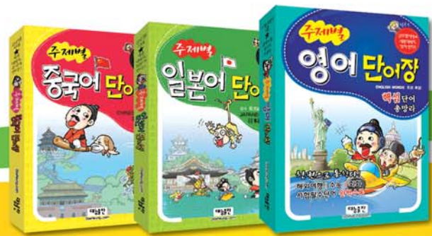
"주제별 단어장" 시리즈 외국인 필수 각권 6,000원