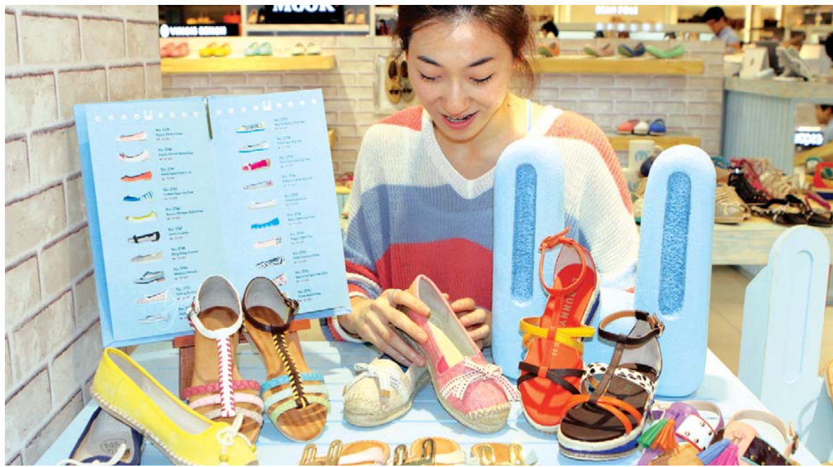
"시원한 여름 나세요" 21일 롯데백화점 광주점 2층 구두 매장에서 한 여성 고객이 마, 나무, 코코넛 등 천연 소재로 만든 여름 샌들을 살펴보고 있다.