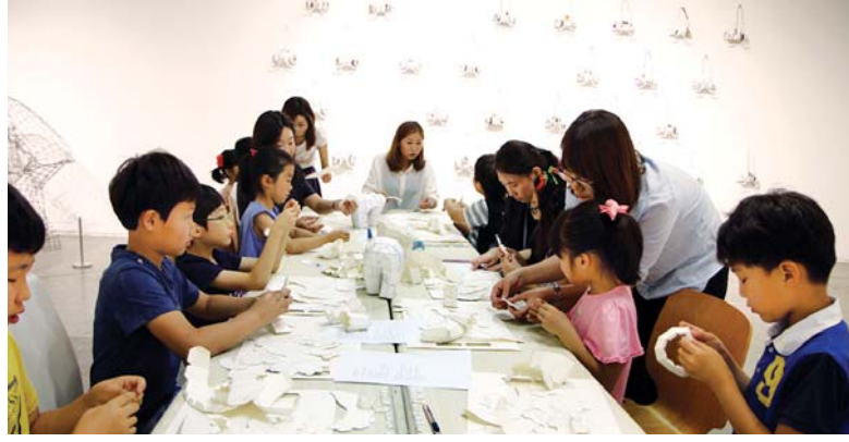
최근 광주신세계 백화점 1층 갤러리에서 열린 환경의 날 관련 '아트클래스'에 참가한 어린이들이 체험활동을 하고 있다.