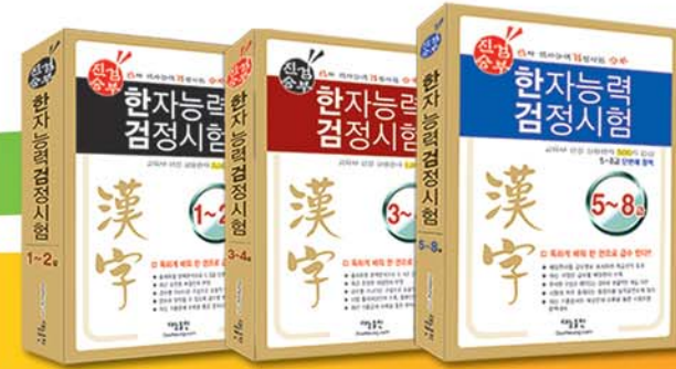
"한자능력검정" 시리즈 대능한자연구회

알짜배기 여행회화 시리즈 · 상황별 핵심 문형과 활용단어 구성 · 여행지의 다양한 정보를 한눈에~