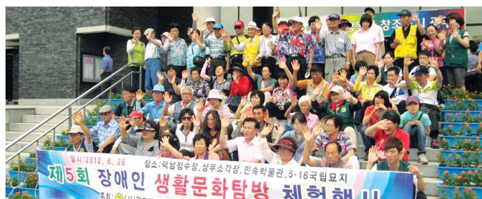
광주 곰두리봉사회 장애인 초청 생활·문화탐방체험