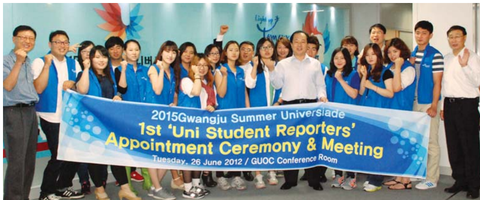
광주 전남지역 학보사 편집장들로 구성된 제1기 유니버시아드 대학생 기자단이 지난 26일 위촉식을 갖고 활동을 시작했다.

글로벌 리포터는 지난해에 이어 올해도 서울 대구 부산 강원 제주 등 전국 주요대학에 재학 중인 학생 33명이 선별, 28~29일 이틀동안 오리엔테이션을 갖고 2015광주유니버시아드에 대한 이해를 바탕으로 블로그와 페이스북 등에 첫 번째 포스팅할 예정이다. 글로벌 리포터는 2015년까지 매년 2회씩 총 200명이 선별, 온라인 홍보메신저로서 대회 성공을 견인하게 된다. 조직위원회 관계자는 "스마트 시대에 소셜 미디어를 활용한 U대회의 효율적인 홍보가 어느 때 보다 필요한 때"라며 "글로벌 리포터들이 곳곳에서 활동하며 광주 소식을 전파하고 관심을 불러모으는 역할을 할 것"이라고 기대했다. 한편 대회 조직위원회는 홍보대사, 서포터즈, 기자단 등 대학생 중심의 지원 그룹을 매년 확대, 세계 대학 스포츠 축제의 주체로서 대회를 함께 준비해갈 계획이다. /최권일기자 cki@kwangju.co.kr