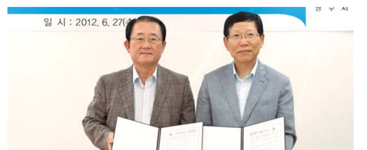
광주대학교(총장 김혁중)와 한국공항공사 광주지사(지사장 김중성)는 27일 대학 회의실에서 산학협력 협약(MOU)을 체결했다.