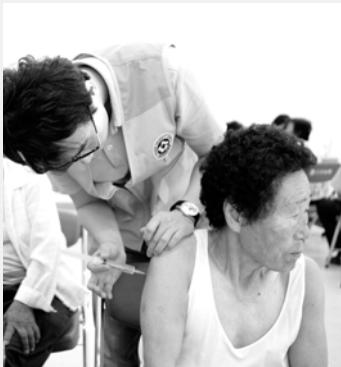
의료봉사를 해야겠다고 생각했다"며 "의료 서비스를 높이는 것도 중요하지만 의료혜택을 받는 분들이 한층 많아질 수 있도록 노력하겠다"고 말했다.