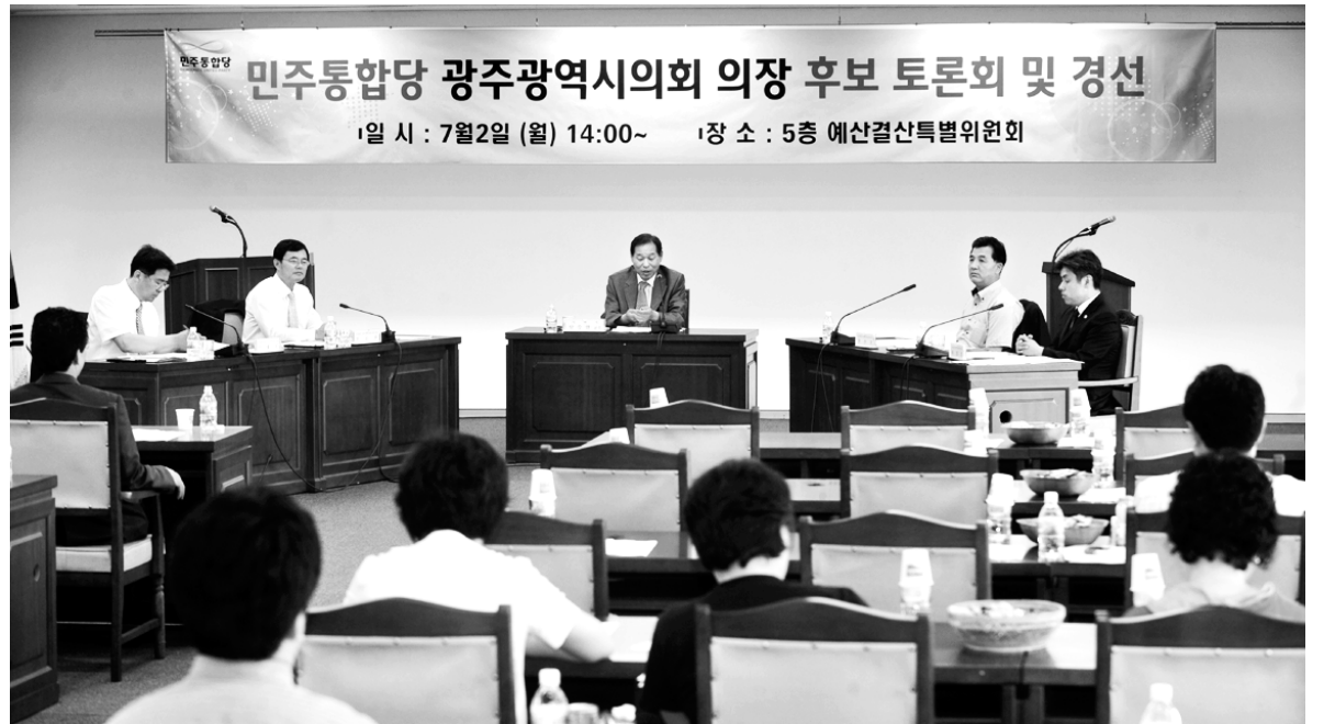
민주통합당 광주시의회 의장 후보 토론회 및 경선투표가 2일 오후 시의회 5층 예산결산특별위원회실에서 열렸다.