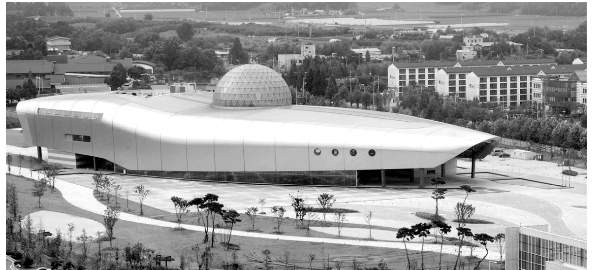
지난해 말 중단됐던 국립광주과학관 건립공사가 이달 중 재개된다. 골조 공사가 모두 마무리된 국립광주과학관의 화려한 외관.