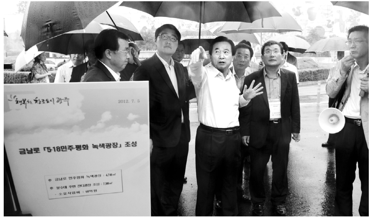
강운태 광주시장이 5일 오후 광주 동구 금남로 분수대 광장 앞에서 '금남로 5·18 민주·평화·녹색광장' 조성사업에 대해 인근 상인, 주민들과 이야기를 나누며 의견수렴을 하고 있다.