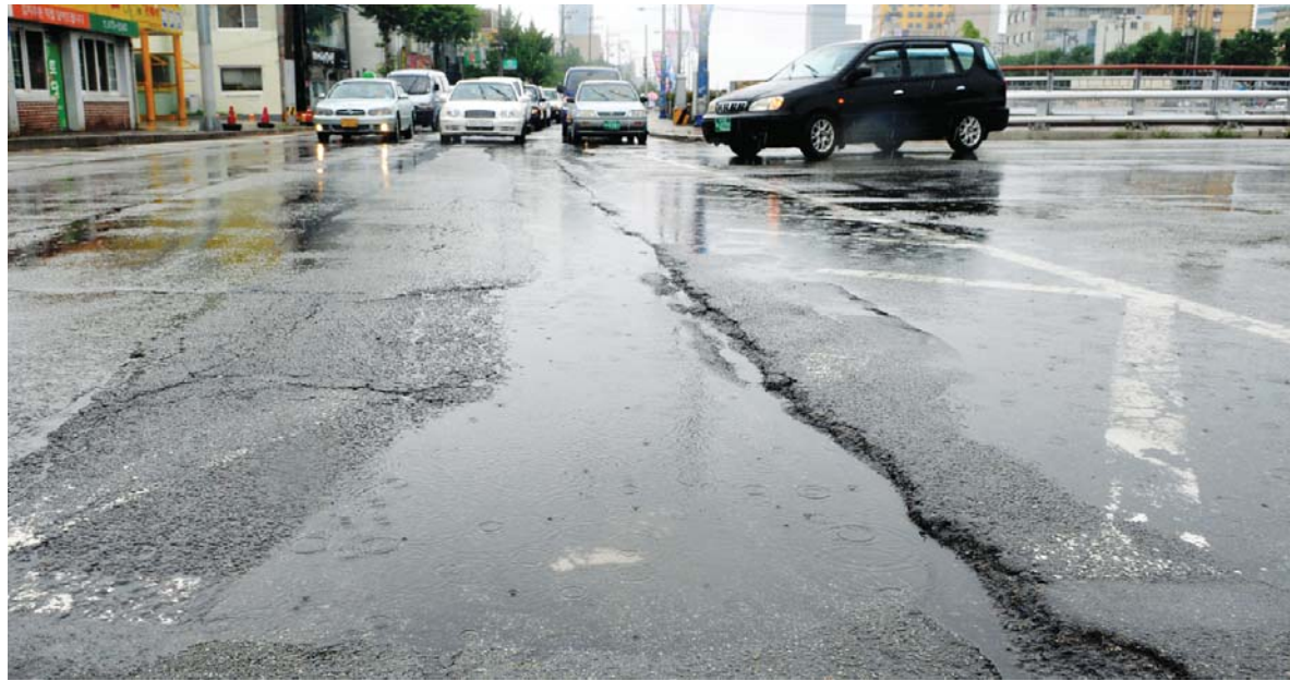
갈라진 도로 위험천만 10일 광주시 남구 서동 앞 천변차로의 노면이 갈라진 채 방치되고 있다.

반면 고검장급은 대법관 후보자가 지검장급에서 나오면서 공석이 생기기 않아 이번에는 수평적인 자리 이동만 하는 순환 인사가 될 것으로 예상된다.