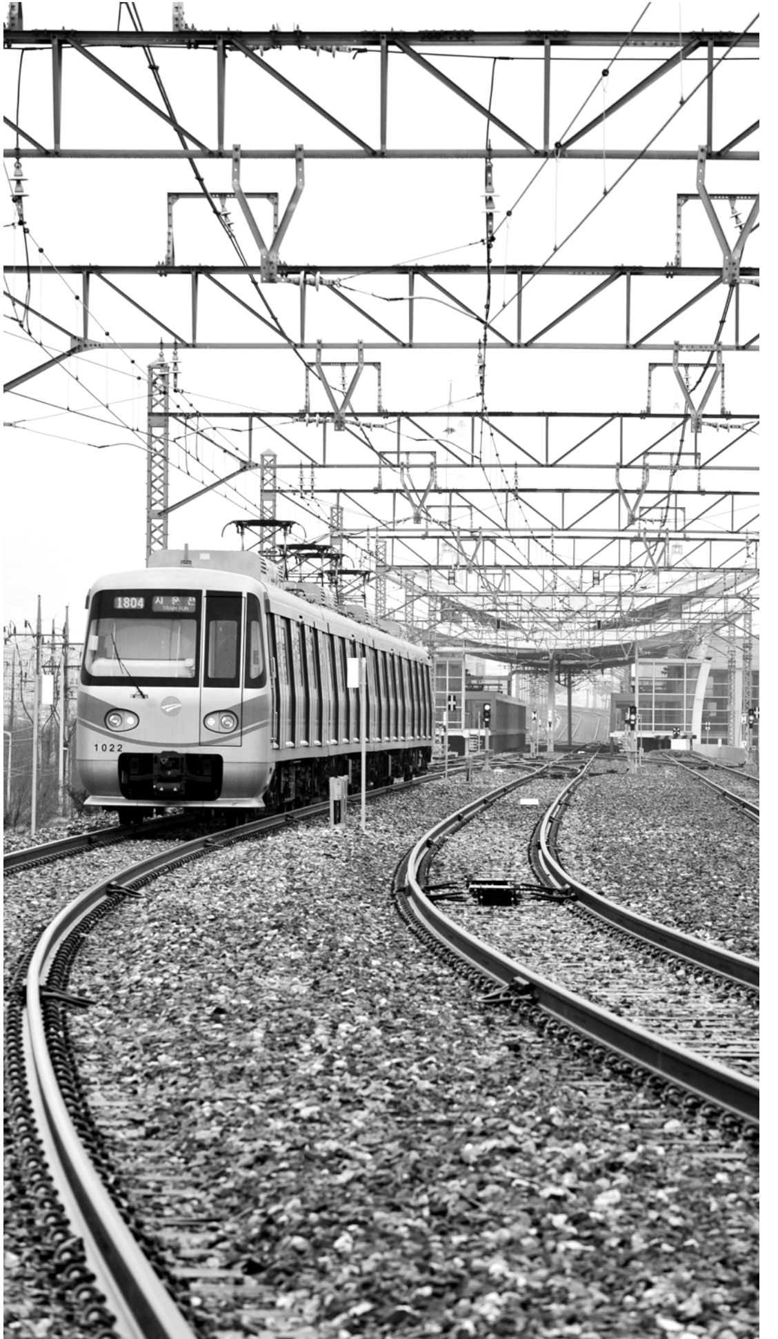
지난 2008년 1월22일 광주도시철도 1호선 열차가 1-2구간 개통을 3개월 앞두고 평동역에서 시운전을 하고 있다. 도시철도 1호선은 2010년 이후 매년 광주시로부터 370억원대의 재정지원을 받고 있다.