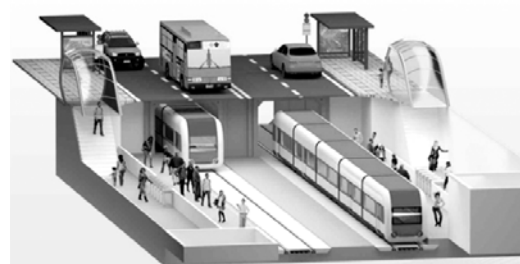
광주 도시철도 2호선 노선도(위)와 저심도 건설방식 경전철 이미지.

가 가속되면 자가용 및 버스 이용객 감소는 필연적"이라며 "도시철도가 개통되면 시민 수송의 가장 우선이 되어 하는데 도시 전체를 내다보는 지혜가 필요하다"고 강조했다.