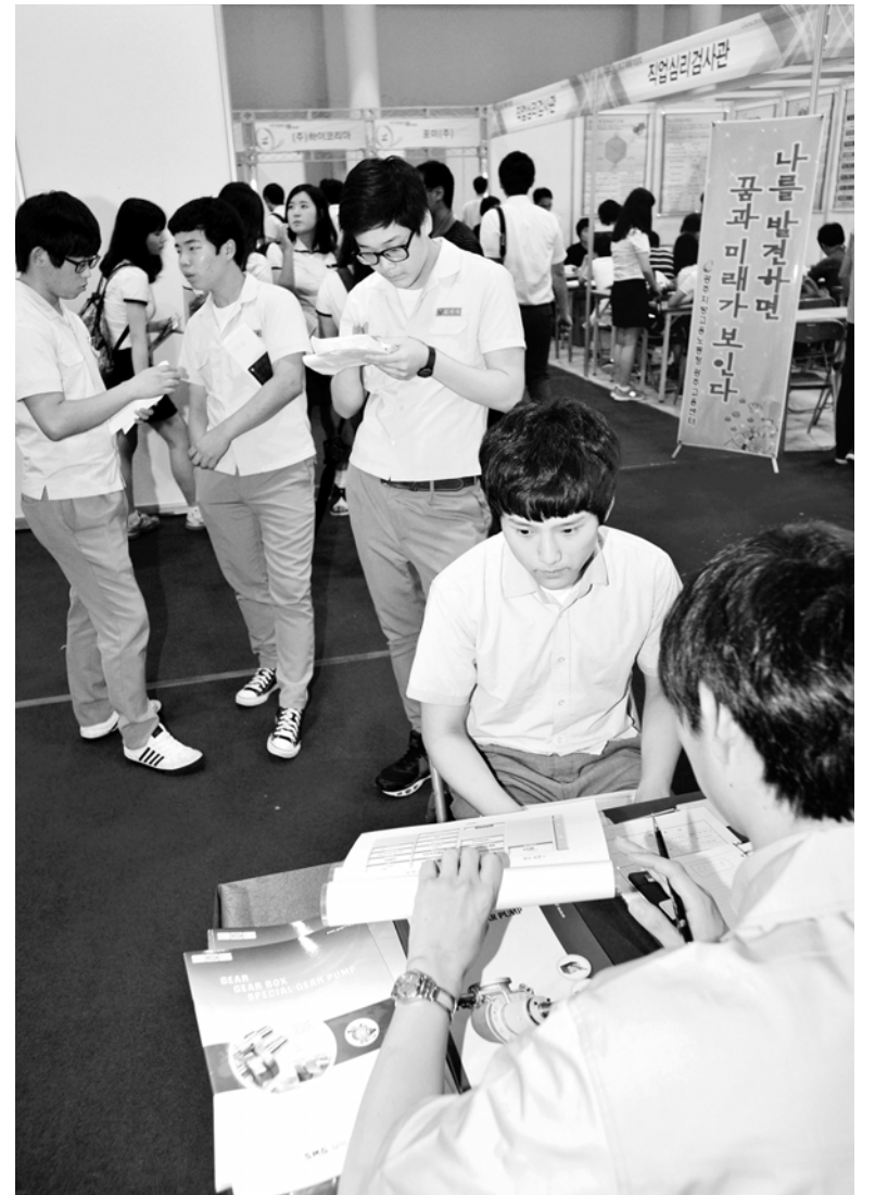
내가 일할 수 있는 곳은 어디? '2012 특성화고 채용박람회'가 17일 오후 광주 북구 장등동 중소기업포럼연수원 체육관에서 열렸다. 해남, 순천 등지에서 온 고등학교 학생들이 자신이 원하는 직종의 부스에서 업체 관계자와 상담을 하고 있다.