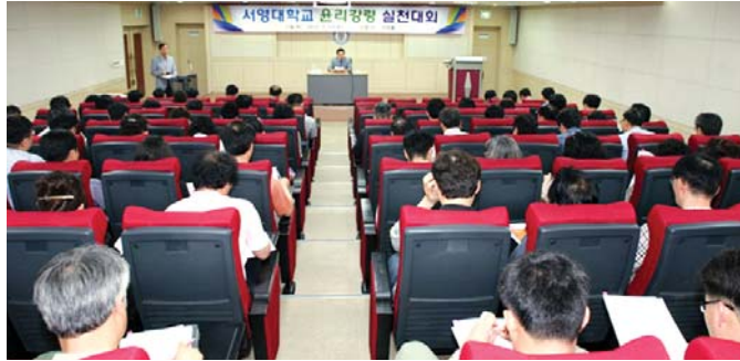
서영대학교(총장 김정수)는 최근 교내 서정홀에서 전체 교직원 150여명이 참석한 가운데 '서영대학교 윤리강령 실천대회'를 가졌다.