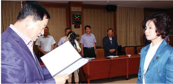
함평군이 최근 열린 '제1회 인구의 날' 행사에서 저출산 극복을 위한 시책 유공으로 국무총리 표창을 수상하고 지난 16일 군청 소회의실에서 전달식을 가졌다. /서부취재본부=황은희기자 hwang@