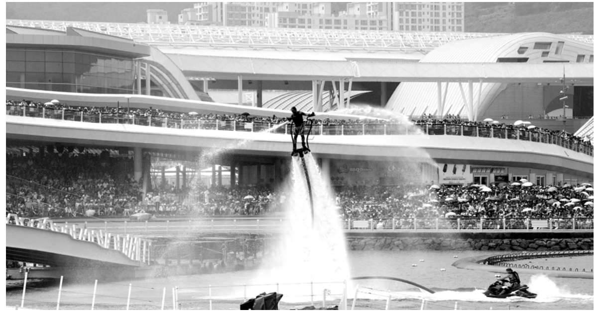
여수세계박람회 일일 관람객 수 최고치인 14만명을 돌파한 지난 21일 박람회장 해상무대 일대에서 펼쳐진 수상쇼에 구름관중이 몰렸다.