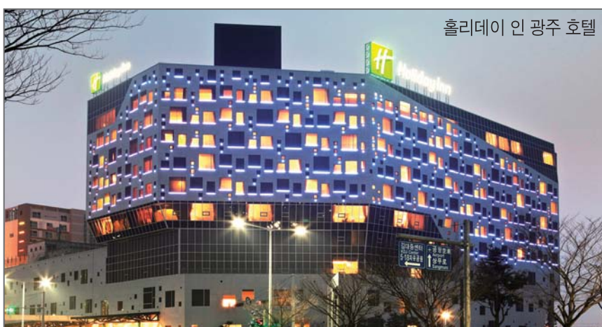
홀리데이 인 광주 호텔