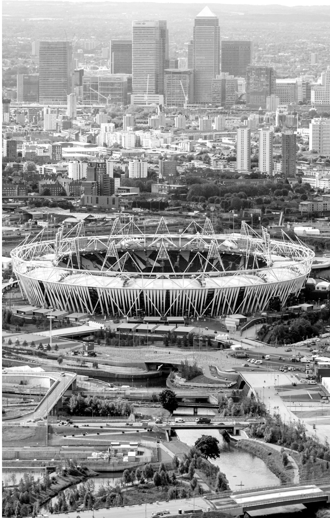
하늘에서 내려다 본 올림픽 메인스타디움 전경. 친환경 컨셉으로 주변 수변공간과 잘 어우러져 있다.