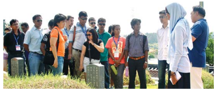
표 시민사회 활동가들 5·18민주묘지 방문

5·18기념재단이 마련한 '5·18아카데미'에 참가한 아시아 지역 시민사회 활동가 22명이 지난 7일 국립5·18민주묘지를 방문, 5·18민주화운동 영령들을 추모했다.