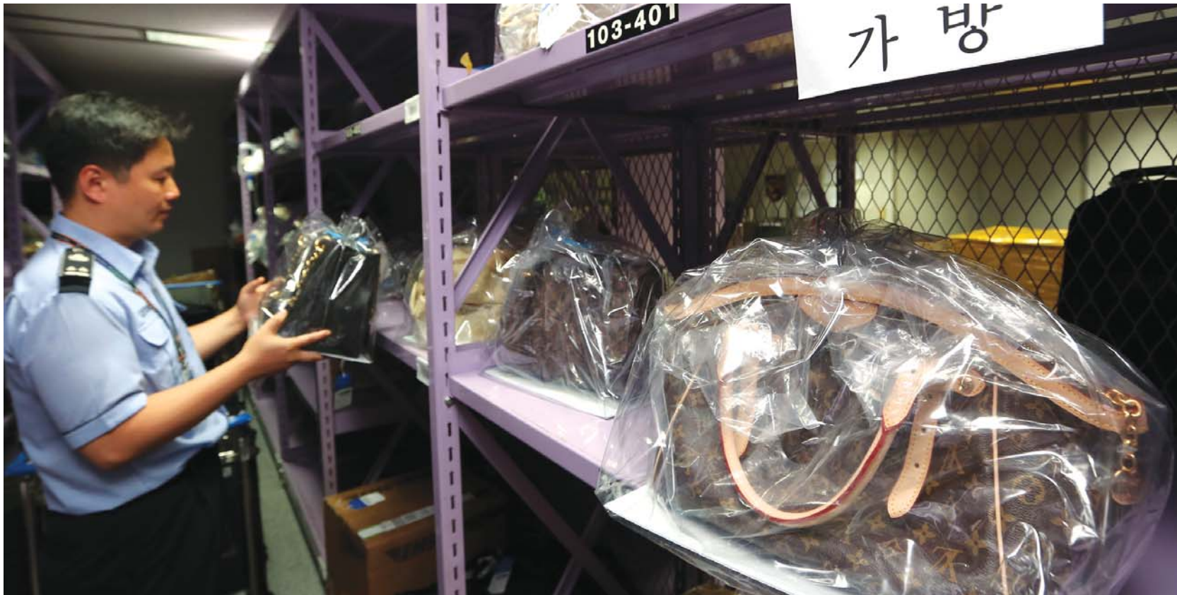
명품백도 사치품... 개별소비세 부과

▲일자리 창출 기업 공제 확대=일반기업의 기본공제는 4%에서 3%로 낮추고 고용증가에 비례한 추가공제는 2%에서 3%로 늘렸다. ▲해외진출기업 국내복귀 시 세제지원=세제지원 적용기한을 2015년 말로 3년간 연장한다. 생산설비를 수입하면 5년간 간세 50%를 감면받는다. ▲특성화고 등 육성을 위한 세제지원 신설= 특성화고·마이스터고 졸업생이 군 복무 후 종전 기업에 복직하면 해당 중소기업이 복직자에게 지급한 급여액의 10%를 2년간 세액공제 해준다. ▲기업상속공제 대상 확대=기업상속공제 대상기업을 매출액 1500억원에서 2000억원 이하로 늘렸다. 2013년 1월1일 이후 상속 개시분부터 적용된다. ▲복합성장 위한 세제 개편=환경보존·에너지절약 시설 투자세액공제 대상에 온실가스 감축시설, 전력저장장치·자동절전 제어장치 추가했다. 친환경 차량(하이브리드 차량)에 대한 개별소비세 등 면제 적용기한은 3년, 경차에 대한 유류세 환급 적용기한은 2년 연장된다. ▲중견기업 R&D비용 세액공제율 확대=중견기업을 지원하기 위해 R&D비용 세액공제 구간(8%)이 신설된다.