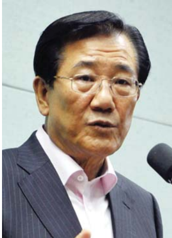
민주통합당 대선경선 박준영 후보가 9일 전북도의회 기자실에서 기자간담회를 하고 있다.

박준영 전남지사가 민주당 대선 후보 경선에서 '변수'로 주목받고 있다. 박 지사가 이번 경선에서 의미 있는 지지율을 확보할 경우, 호남의 대표 주자로 부상되면서 본선은 물론 결선 투표시 결정적 영향을 미칠 수 있기 때문이다. 일단 박 지사가 이번 경선에서 최대 변수로 부상하기 위해서는 최소 5%이상의 지지율을 확보해야 할 것으로 분석되고 있다. 박 지사가 순회 경선에서 5% 미만의 지지율을 보일 경우, 호남의 대표 주자라는 상징성을 상실하면서 문재인·손학규·김두관 후보 등 3인의 원심력에 휘말리는 것은 물론 최악의 경우, 완주도 어려울 수 있다는 것이 정치권의 지적이다. 특히, 박 지사의 선전을 위해서는 민주당의 첫 번째 순회 경선지역인 제주에서의 성적이 결정적인 영향을 미칠 전망이다. 비교적 호남세가 두터운 제주에서 박 지사가 선전할 경우, 이 같은 흐름이 타 지역 순회 경선에서도 유지되면서 광주·전남지역 경선에서도 최고점에 이를 수 있기 때문이다. 이와 관련, 박 지사 캠프에서는