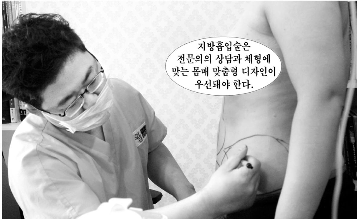
지방흡입술은 전문의의 상담과 체형에 맞는 몸매 맞춤형 디자인이 우선돼야 한다.

지방흡입의 효과적인 부위로는 얼굴과 바디라인 어느 곳이든 가능하겠지만 복부와 옆구리 허리를 비롯한 러브밴들, 뱀에 비해 발달된 팔과 허벅지 및 종아리, 그리고 브이라인을 위해 이중턱 지방흡입 등 거의 모든