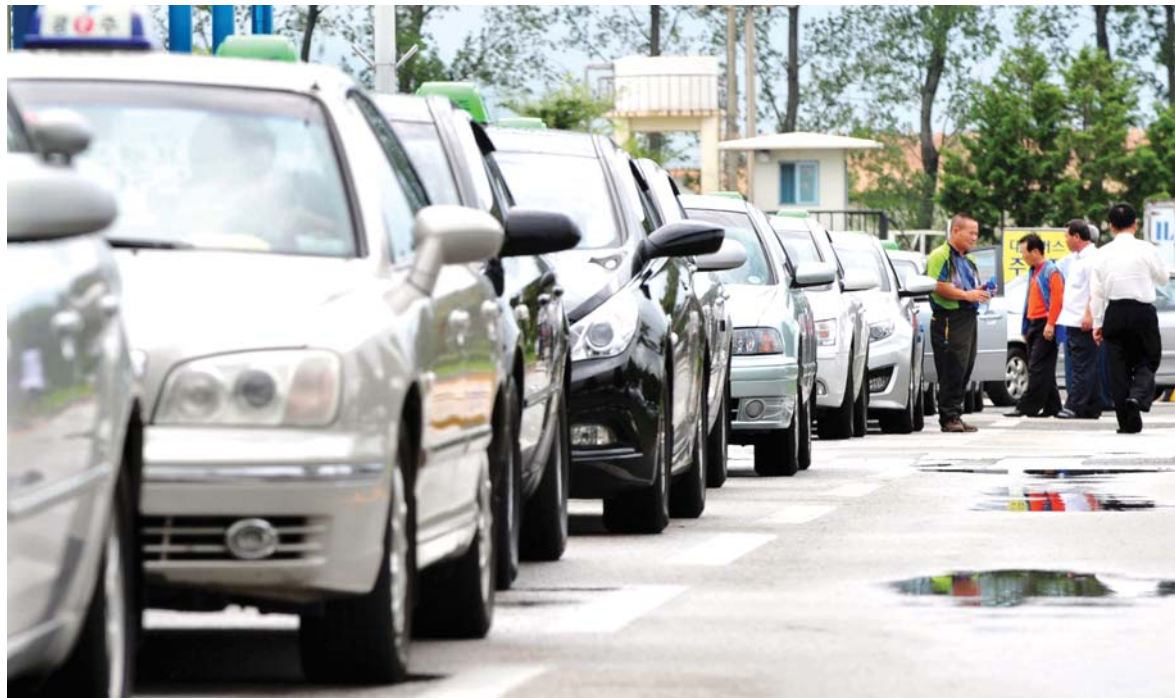
서민들이 지갑을 닫으면서 경제불황의 악순환이 이어지고 있는 가운데 15일 오후 광주 광산구 광주공방 내 택시정류장에 빈 택시들이 길게 줄지어 서 있다.

◇각쟁이 소비, 사교육비까지 축소=장기적인 불황은 서민들을 각쟁이 소비자로 만들고 있다. 물건 하나를 사더라도 철저히 비교해싼 상품을 구매하는 것은 기본이고 할인권이나 문화상품권을 적극 활용하고 있다.