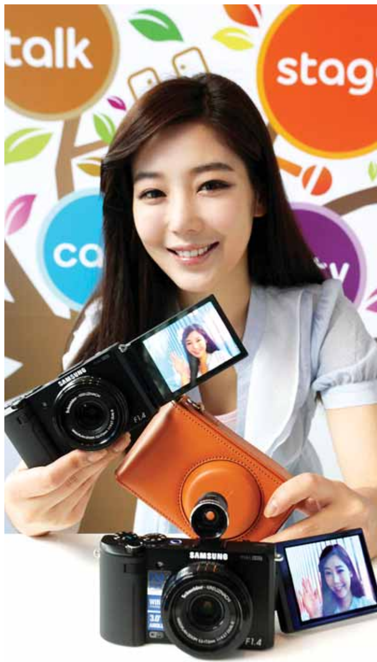
삼성 스마트카메라 'EX2F' 출시 삼성전자는 콤팩트 카메라로 렌즈 밝기가 가장 밝은 스마트 카메라 'EX2F'를 출시했다고 20일 밝혔다. EX2F는 렌즈 밝기(조리개 수치) F1.4에 광각 24mm를 지원해 어두운 곳에서도 밝고 선명한 사진을 찍을 수 있다.