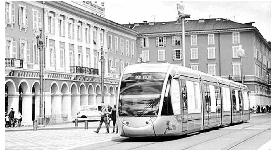
수원시가 채택할 계획인 외국의 지상노면전차 모델.