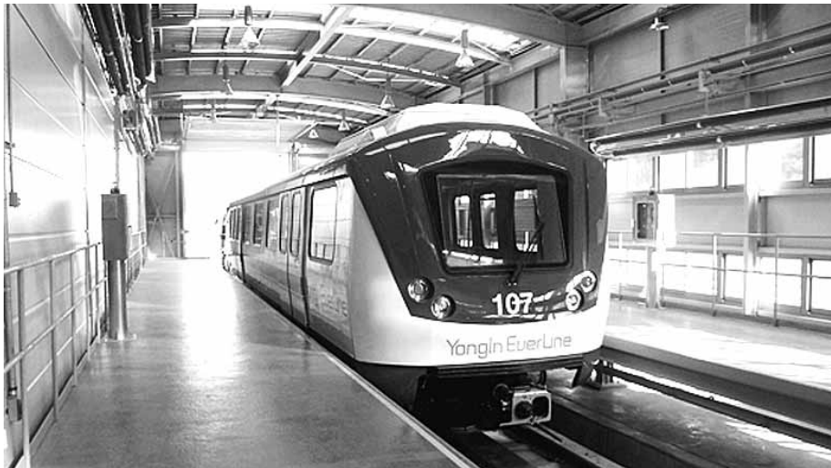
용인시의 고가경전철 방식 도시철도.