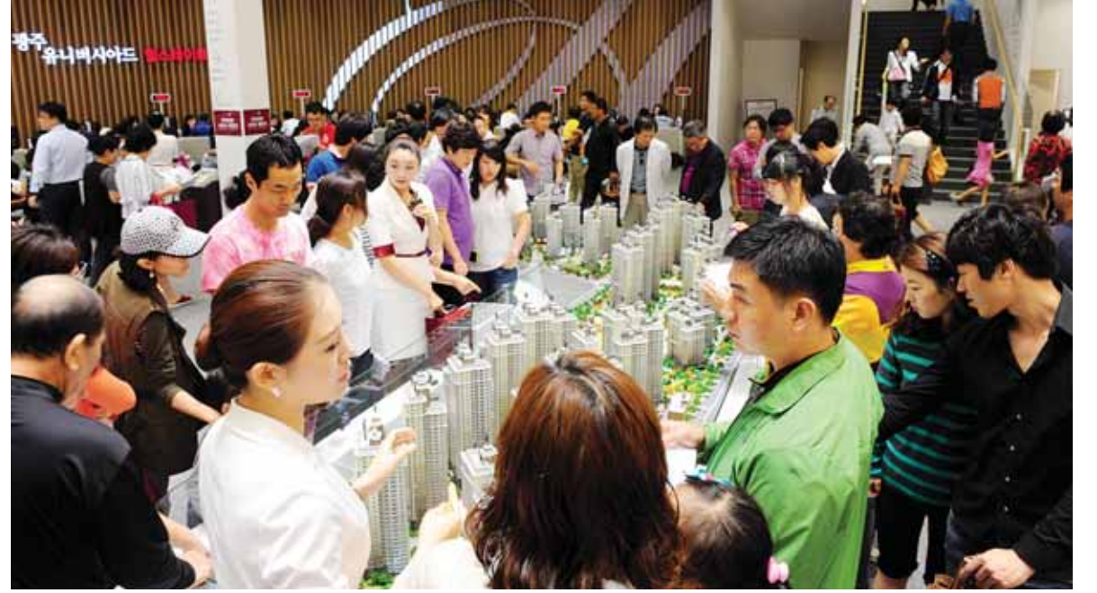
광주U대회 선수촌으로 활용되는 광주 유니버시아드 힐스테이트 아파트 건본주택에 9일 오후 수요자들이 몰려 북새통을 이루고 있다.

지난해 4월부터 시행된 'SOS 국민 안심서비스'는 위급상황에서 휴대전화나 스마트폰, 전용단말기를 이용해 맡았을 버튼만 누르면 112신고센터에 신고자 위치정보가 제공돼 빠른 구조가 이뤄질 수 있게 한 시스템이다. /박정욱기자 jwpark@kwangju.co.kr