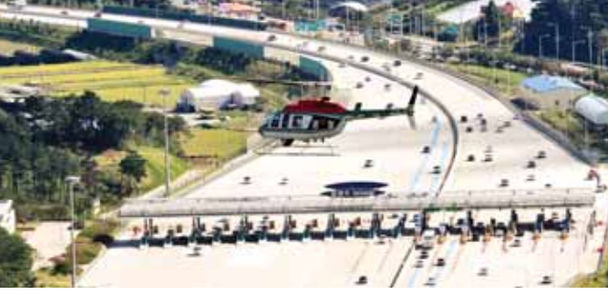
전남지방경찰청(청장 안재경)은 추석 명절 교통 혼잡을 최소화하기 위해 지난해 28일부터 4일까지 교통경찰 255명과 헬기·순찰차 등 장비 235대를 동원, 특별 교통관리 근무를 실시했다.